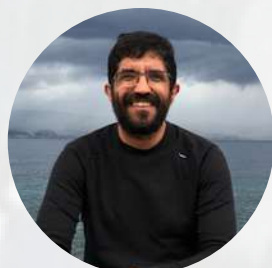
Cultura Carlos Silva García